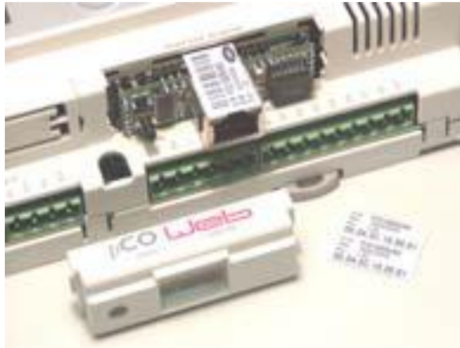
Figure 1.c – Inserting pCOWeb in the pCO controller