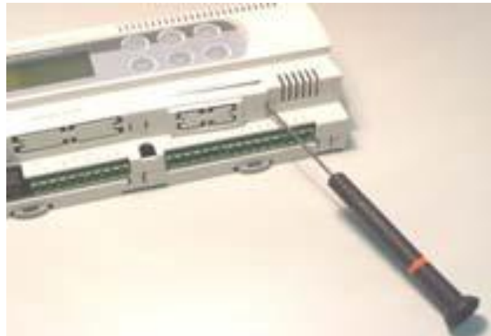
Figure 1.b – Removing the cover from the pCO controller

IMPORTANT: to avoid damage, before inserting pCOWeb disconnect power to the pCO controller