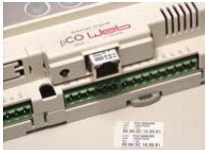
Figure 1.d – Securing pCOWeb with the cover