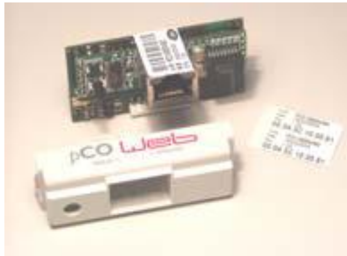
Figure 1.a – pCOWeb and the accessories supplied